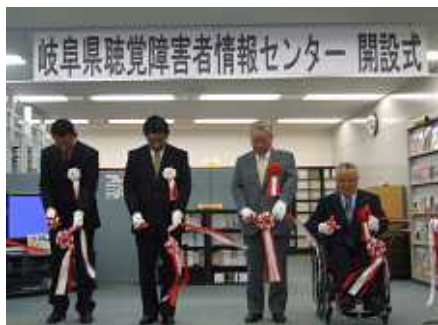
テープカットされた瞬間