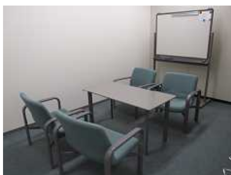
相談室（個室になっております）