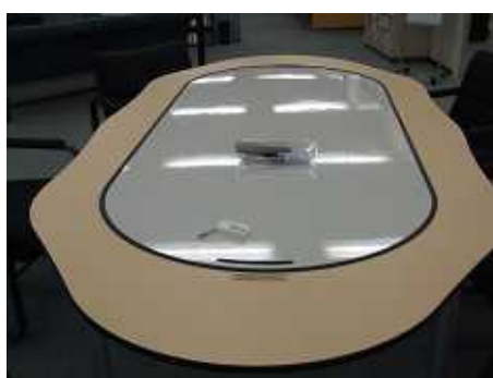
ホワイトボード兼用のテーブル 筆談を交えての相談事に便利です。