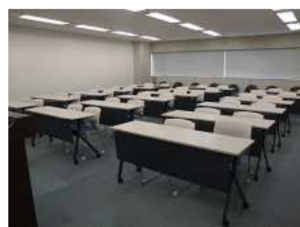
ボランティア室（定員約40名）