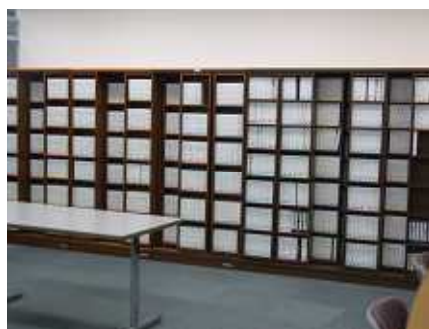
ビデオライブラリー貸出室 約2000本のタイトルがあります。