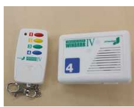
無線呼出し装置。番号を押すと担当者を出呼することができます。