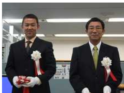
水野本会会長と古田岐阜県知事