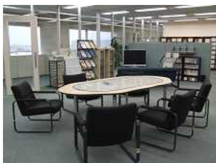
交流スペース （約20名程度利用可能です）