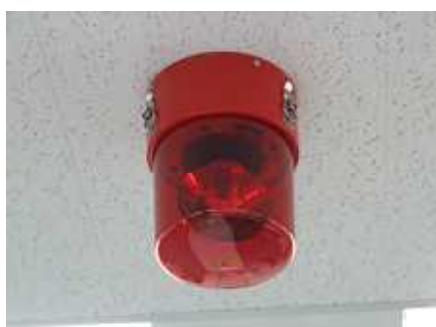
緊急事態をお知らせする大型パトライトが天井に設置されています。